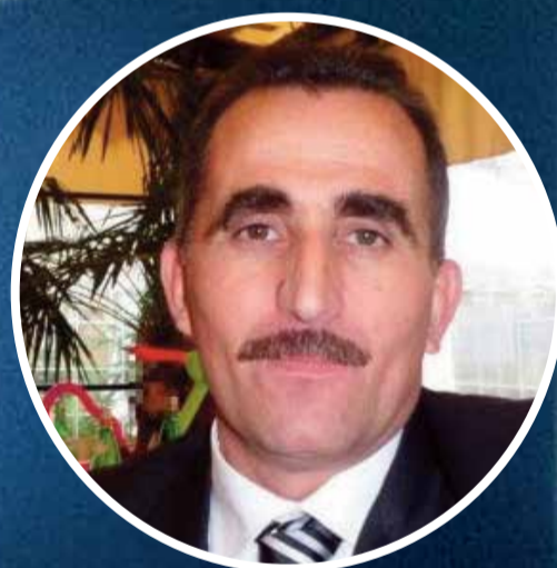
Bova Centro Destra