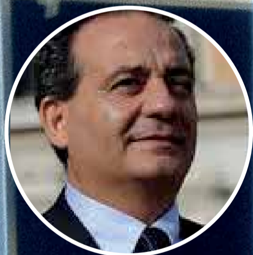
Caudo Centro Sinistra